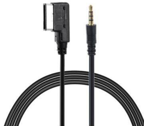
(voorbeeld AMI-AUX kabel)

Een AMI-poort wordt mogelijk pas actief zodra er een AUX-AMI-kabel op wordt ingeplugd (optioneel te koop in onze webshop). Sluit niets aan op de AUX-plug.